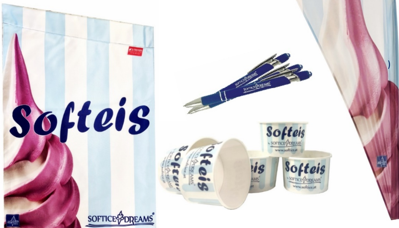
Symbolfotos (nicht Maßstabgetreu)

Unsere Eisfahne und die Beachflag im SofticeDreams® Design sind die perfekten Eyecatcher für die Außenwerbung.